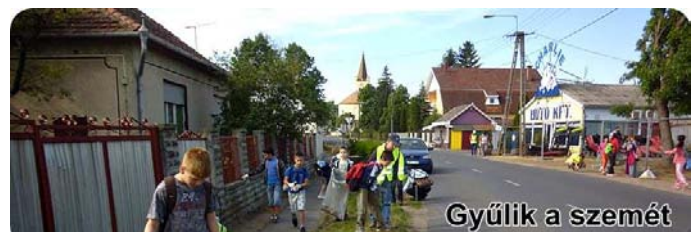
Gyűlik a szemet

„ TE SZEDD! – Önkéntesen a tiszta Magyarorszáért ” akcióhoz kapcsolódva május 10-én 7 utcát tisztítottunk meg és kb. 350-400 tő virágot ültettünk el. >>>>>>/folytatás a 8. oldalon/