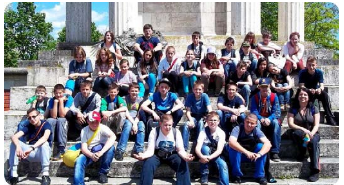
A hatodikosok Ópusztaszeren

5. évfolyam: Mátra, 6. évfolyam: Szeged -Ópusztaszer, 7. évfolyam: Budapest és a Duna-kanyar.