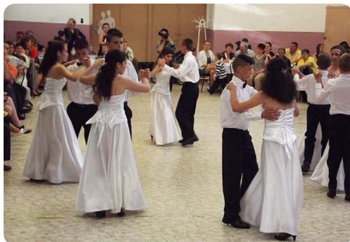
Az első bálozók első tánca