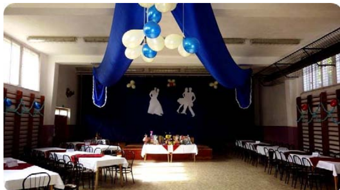
A báli ruhába öltöztetett tornaterem

Május 10-én este iskolánk hangulatosan feldíszített tornatermében került megrendezésre a hagyományos bál. 12 gyermek családjuk, ismerőseik és tanáraik előtt mutathatták meg, hogy a tanár úr segítségével hogyan sajátították el a társastánc alapjait.