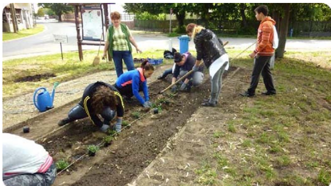
Parkosítás a Kassai utcán

A virágpalántákról „A Korszerű Iskoláért” Alapítvány, Létavértes Város Önkormányzata, és adományozó lakosok gondoskodtak, amelyért ezúton is köszönetet mondok. Az iskola tanulóihoz és dolgozóihoz csatlakoztak szülők és települési képviselő is.