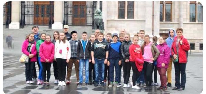
Hetedikesek a Parlament épülete előtt

A 8. évfolyamosok május elején három napos Zempléni kiránduláson vettek részt, ahol többek között megtekintették a Tiszaleti Hőerőművet, Kossuth Lajos szülőházát, a Vizsolyi bibliát, Boldogkő várát, és túráztak a Borsó hegyen (ahol megnézték a 2006-ban lezuhant szlovák NATO gép áldozatainak emlékművét), és kipróbálták Magyarország leghosszabb bob pályáját.