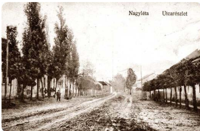
A Kossuth utca eleje, jobbra az iskola, szemben a Községháza. A fotó: az 1920-as években készült, láthatóan eső után.