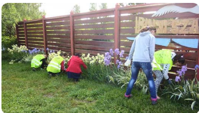
A tavaly ültetett virágokra is ráfért a gondozás

A takarítási mozgalmat papírgyűjtés előzte meg, melynek köszönhetően az AKSD konténeribe 20 mázsa papírhulladék került. Diákönkormányzatunkat nagymennyiségű kartonpapírral támogatta a Vértesi Református Szeretetház konyhája, melyért ezúton is köszönetet mondunk.