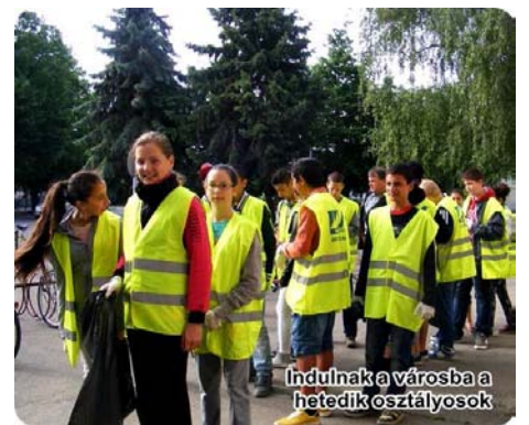
Indulnak a városba a hetedik osztályosok

Minden iskolaudvaron, s az utcai fronton is dolgoztunk, s reméljük késő őszig gyönyörködhethetünk az ültetett növények szépségében.