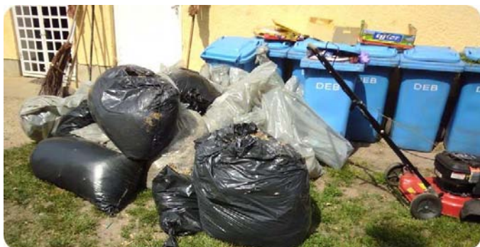
Az egyre gyarapodó szemétkupac

A virágpalántákról „A Korszerű Iskoláért” Alapítvány, Létavértes Város Önkormányzata, és adományozó lakosok gondoskodtak, amelyért ezúton is köszönetet mondok. Az iskola tanulóihoz és dolgozóihoz csatlakoztak szülők és települési képviselő is.